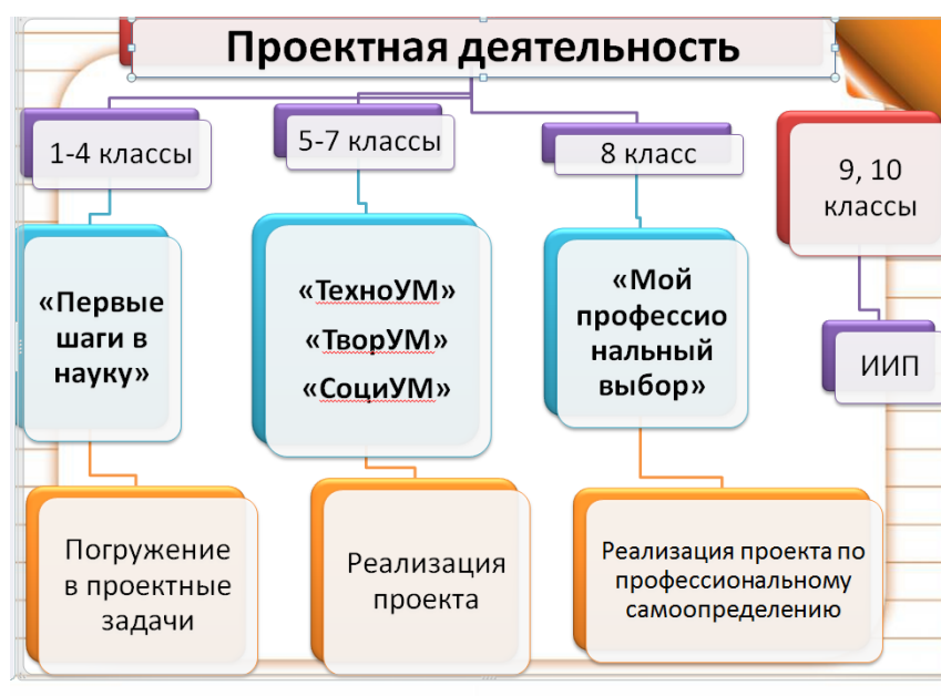
Рис.2 Организация проектной и исследовательской деятельности обучающихся.

выступлению «Мой профессиональный выбор», в 9,10 классах реализовался Индивидуальный проект ( см. Рис.2).